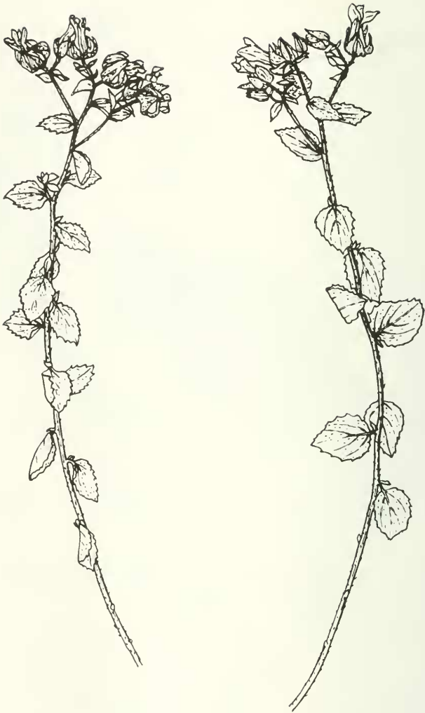
Abb. 4: Campanula ariana Podlech (PODLECH 11469) 1/2 nat. Größe